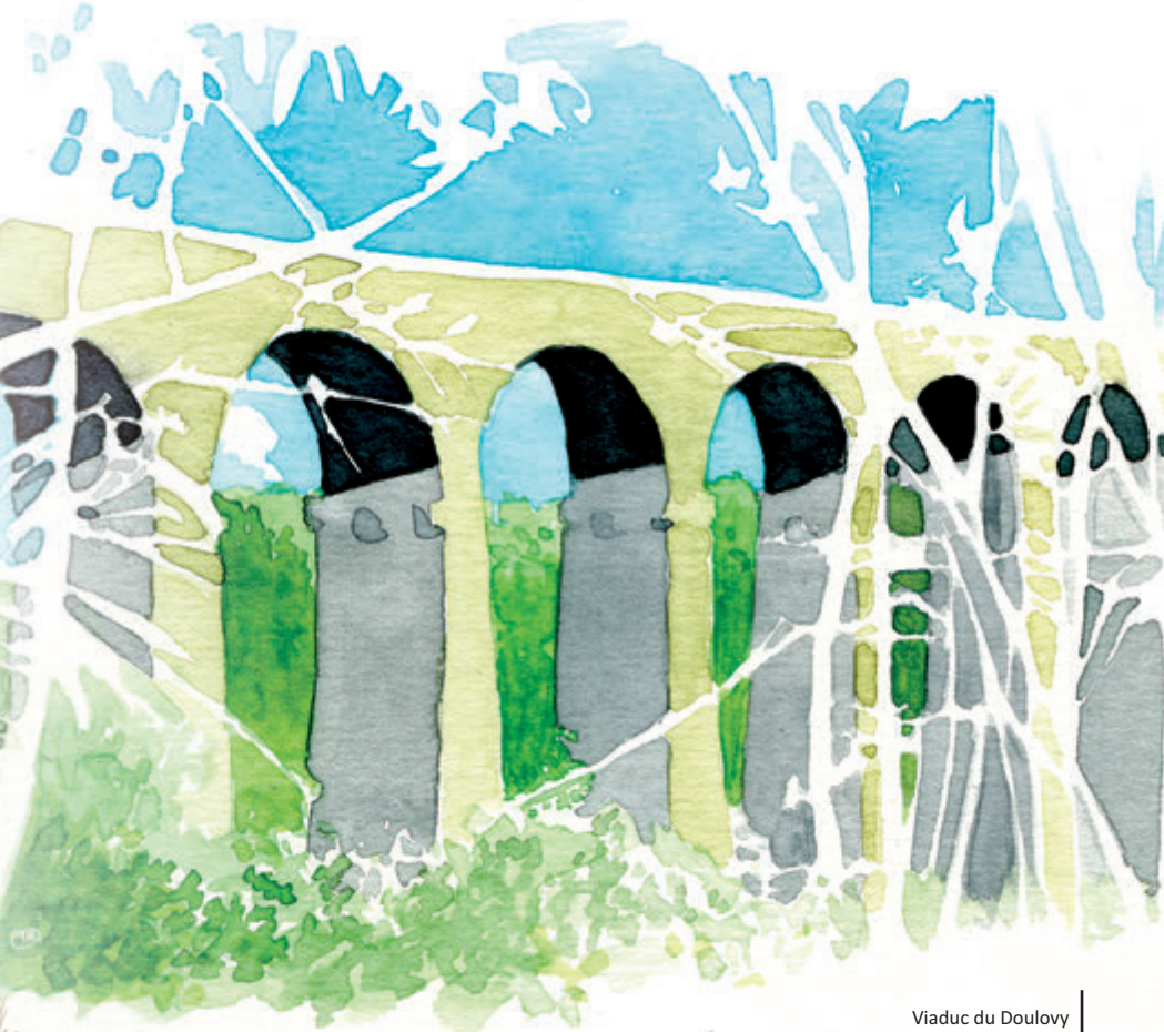
Viaduc du Doulovy Illustrations : Thierry ROURE