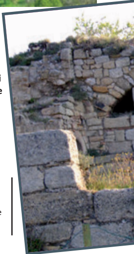
Ruines des cuisines du château de Banne

Visite libre de l'église le samedi 16 de 10h à 18h et le dimanche 17 de 10h à 17h.