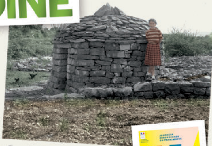
Capitellas. Chemins de Casteljaou